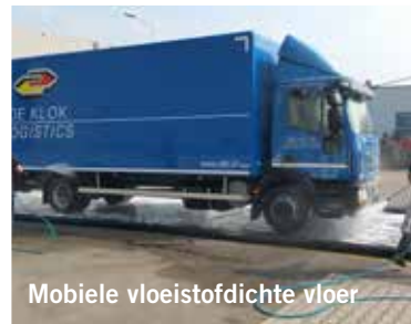
Mobiele vloestofdichte vloer